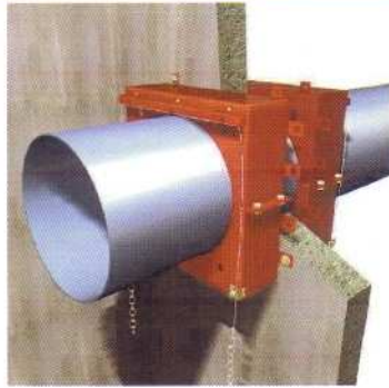
EI 90 en voile 1

Pour tuyaux thermoplastiques de 355 mm à 500 mm